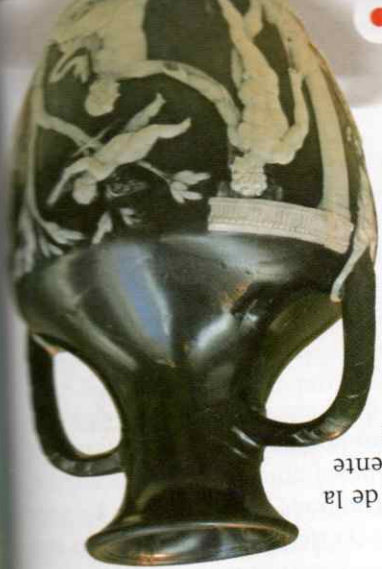
Vasija romana del siglo I

• Fuentes audiovisuales. Son todos los registros gráficos y sonoros de una época, como pinturas, murales, películas, fotografías, discos, cassetes, archivos digitales de audio y vídeo, etc. Por supuesto que algunas de estas fuentes solo existen desde el siglo XX.