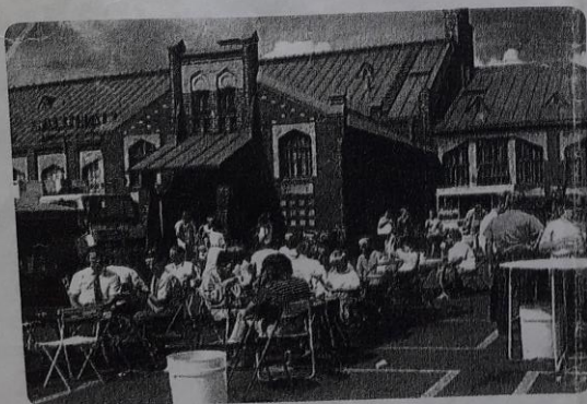
Santillana S. A. Prohibida su reproducción.

esperanza de vida. Es la cantidad de años que se espera que, en promedio, vivan los miembros de un grupo.