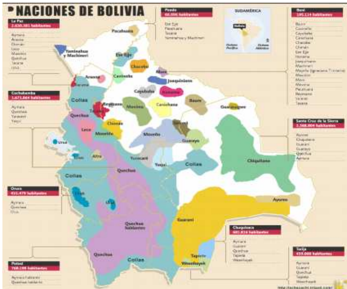
La Constitución reconoce diversos derechos a los pueblos indígenas en su capítulo cuarto, “Derechos de las Naciones y Pueblos Indígena Originario Campesinos” (artículos 30 a 32), y determina que los idiomas oficiales de Bolivia son 37: el castellano y las lenguas de las 36 naciones y pueblos indígena originario campesinos (artículo 5).

Las formas en que las naciones indígenas se relacionan con la naturaleza y el espacio son muy diferentes de la lógica del Estado territorial moderno de la conquista de la naturaleza. Si bien han existido durante cientos de años, hasta hace poco fueron ignoradas en su mayor parte por las ciencias políticas. El reconocimiento oficial de los territorios indígenas ha dado lugar ahora a la aprobación legal de una territorialidad diferencial a nivel subnacional, que ha creado autoridades territoriales diferentes del gobierno nacional en el espacio del Estado nación.